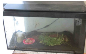
un élevage de phasmes "dragon" et un élevage d'escargots