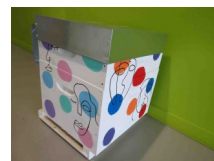
Ruche décorée à l'école

Enfin, le samedi 11 juin à Saint-Séverin-sur-Boutonne, les élèves vous expliqueront eux-mêmes ce qu'ils ont appris durant cette année scolaire sur les escargots, les hérissons, les vers de terre et les plantes sauvages comestibles. Cela sera l'occasion d'observer le rucher de Saint Séverin.